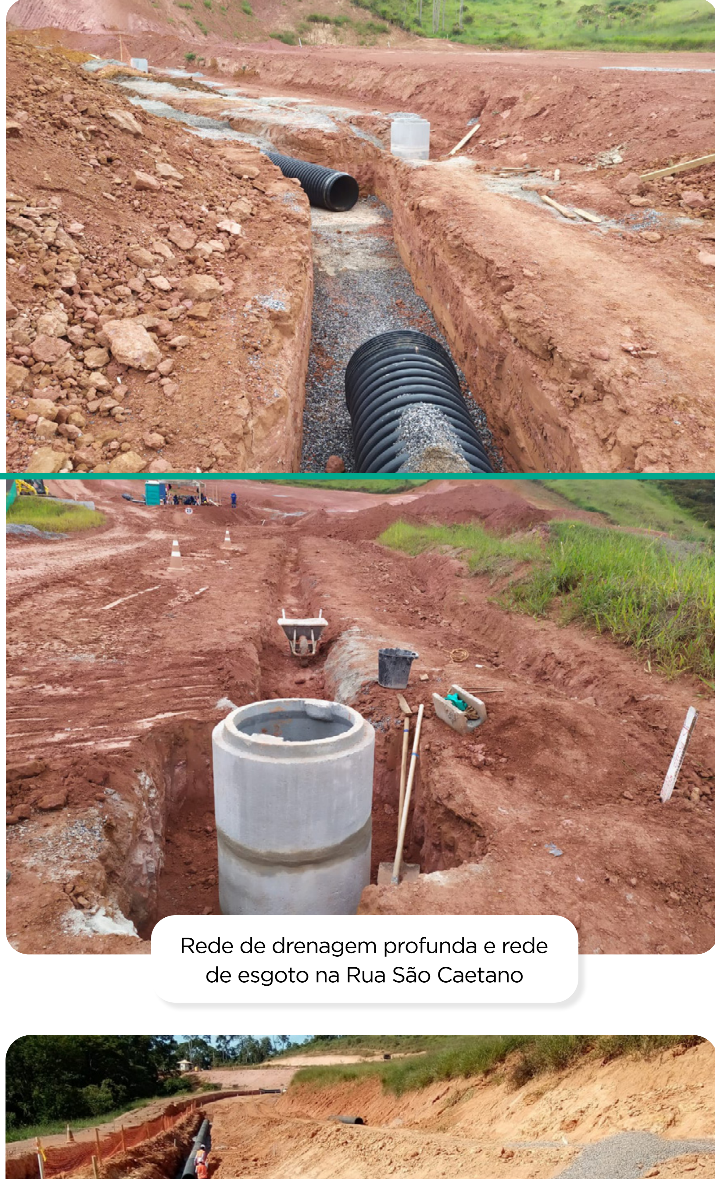
Rede de drenagem profunda e rede de esgoto na Rua São Caetano