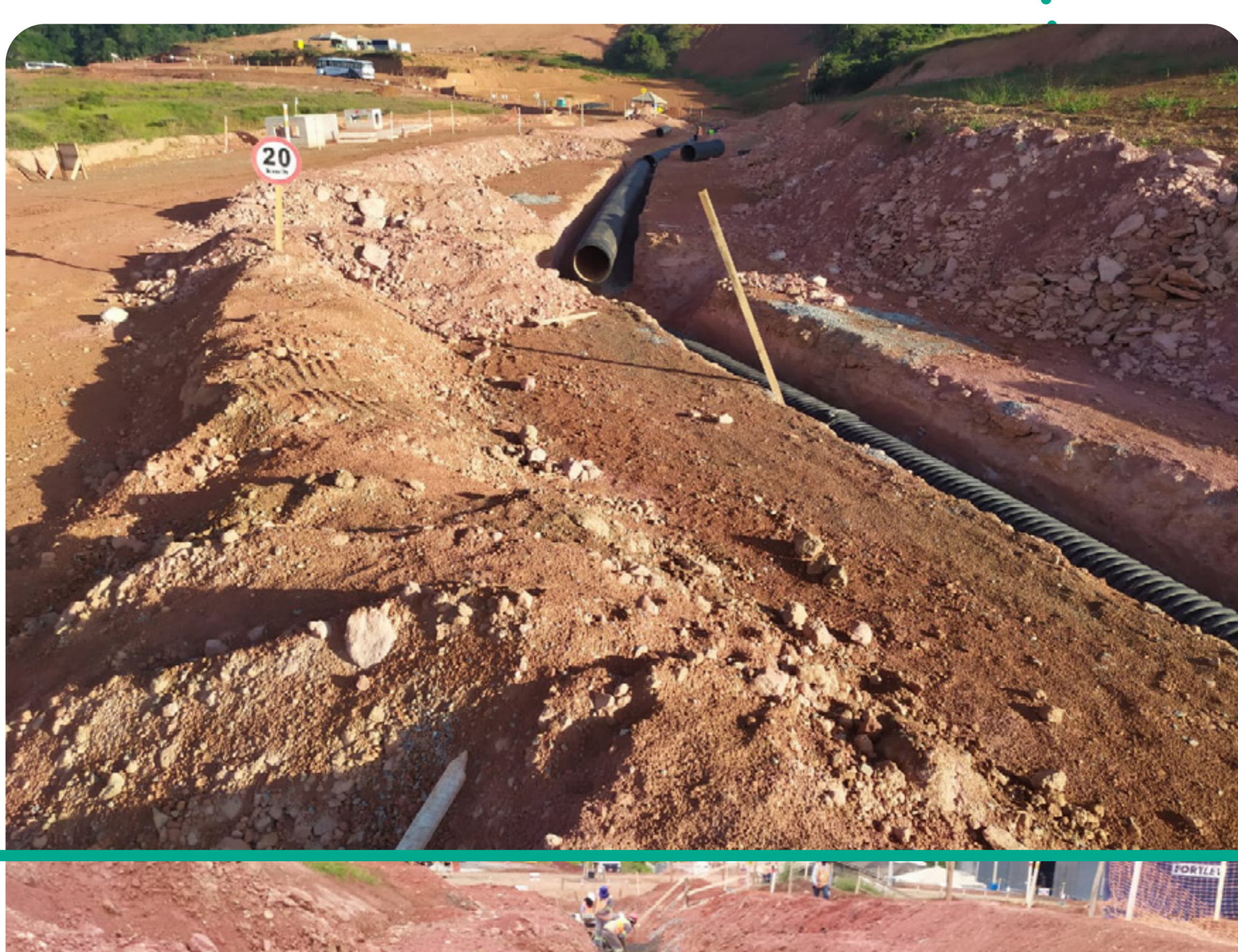
Rede de drenagem profunda na Rua Gualaxo