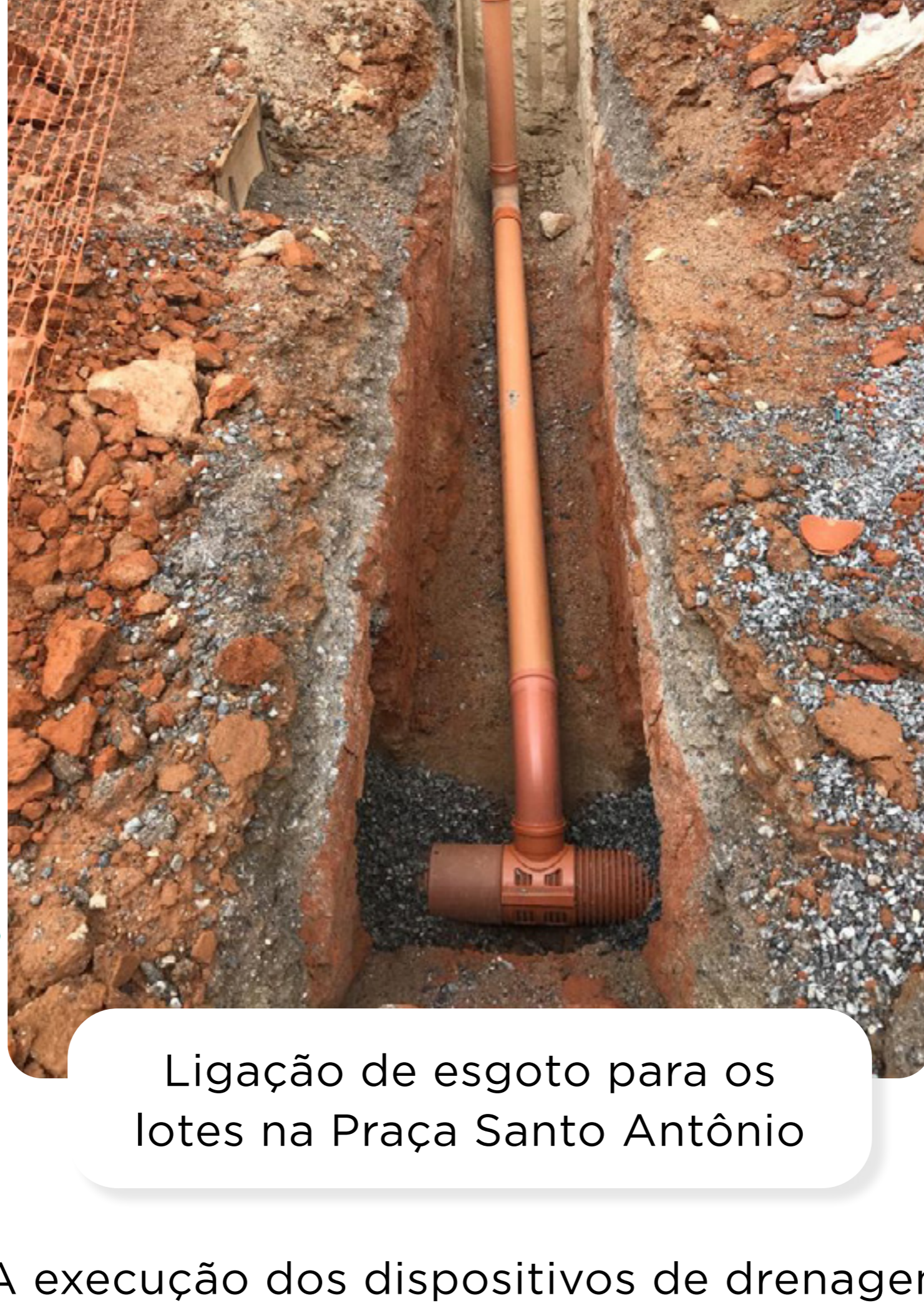
Ligação de esgoto para os lotes na Praça Santo Antônio

A execução dos dispositivos de drenagem superficial das águas de chuvas e a instalação de meio-fio também continuam.