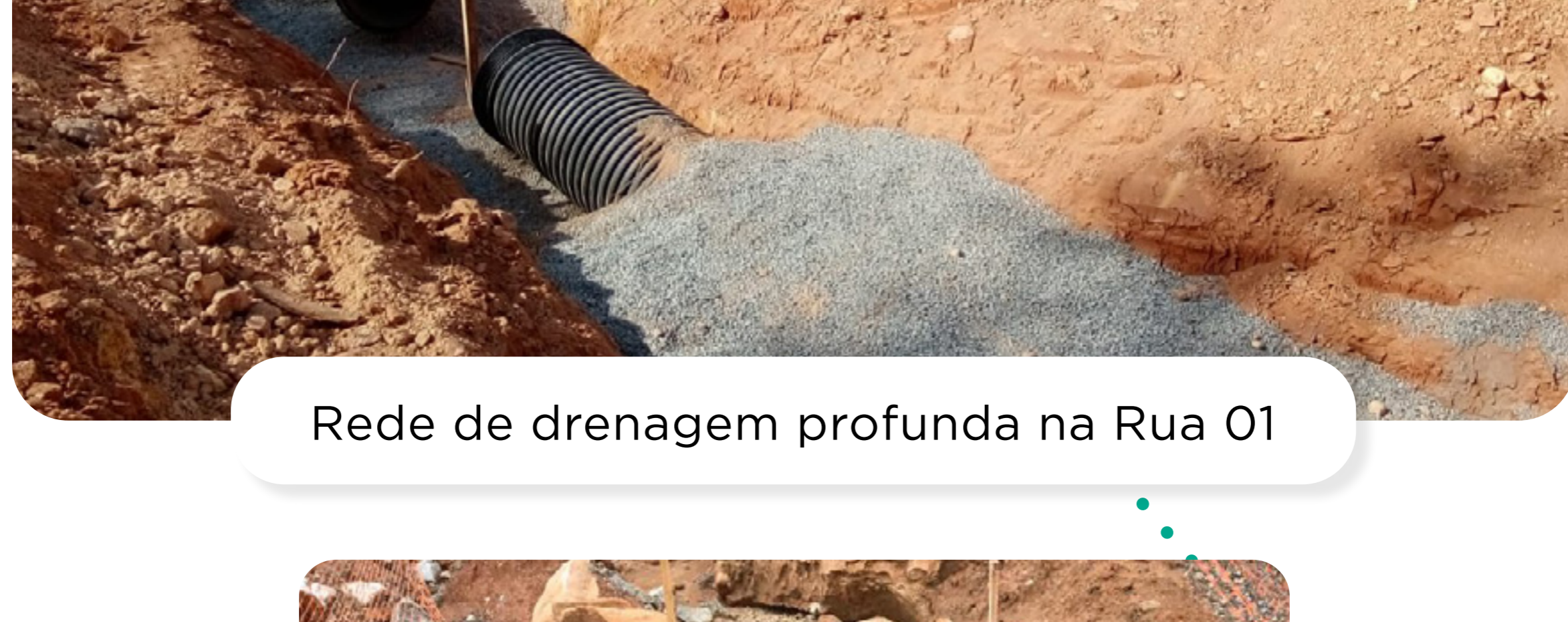
Rede de drenagem profunda na Rua 01