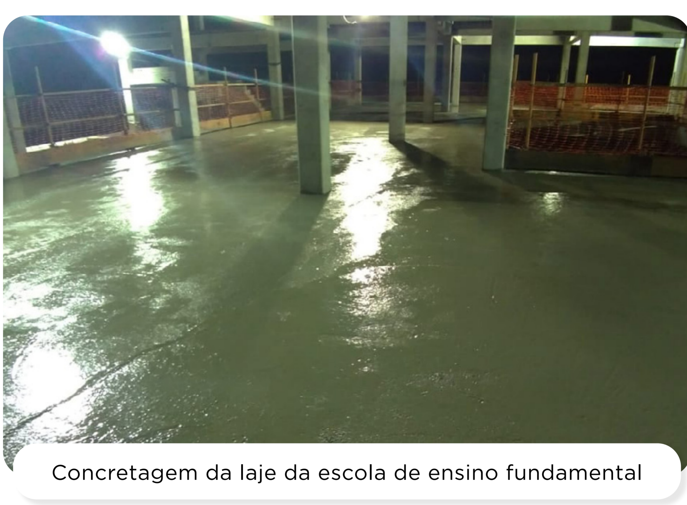
Concretagem da laje da escola de ensino fundamental

As lajes do segundo pavimento da escola de ensino fundamental foram concretadas. Já na escola de ensino infantil, seguimos com a montagem das lajes.