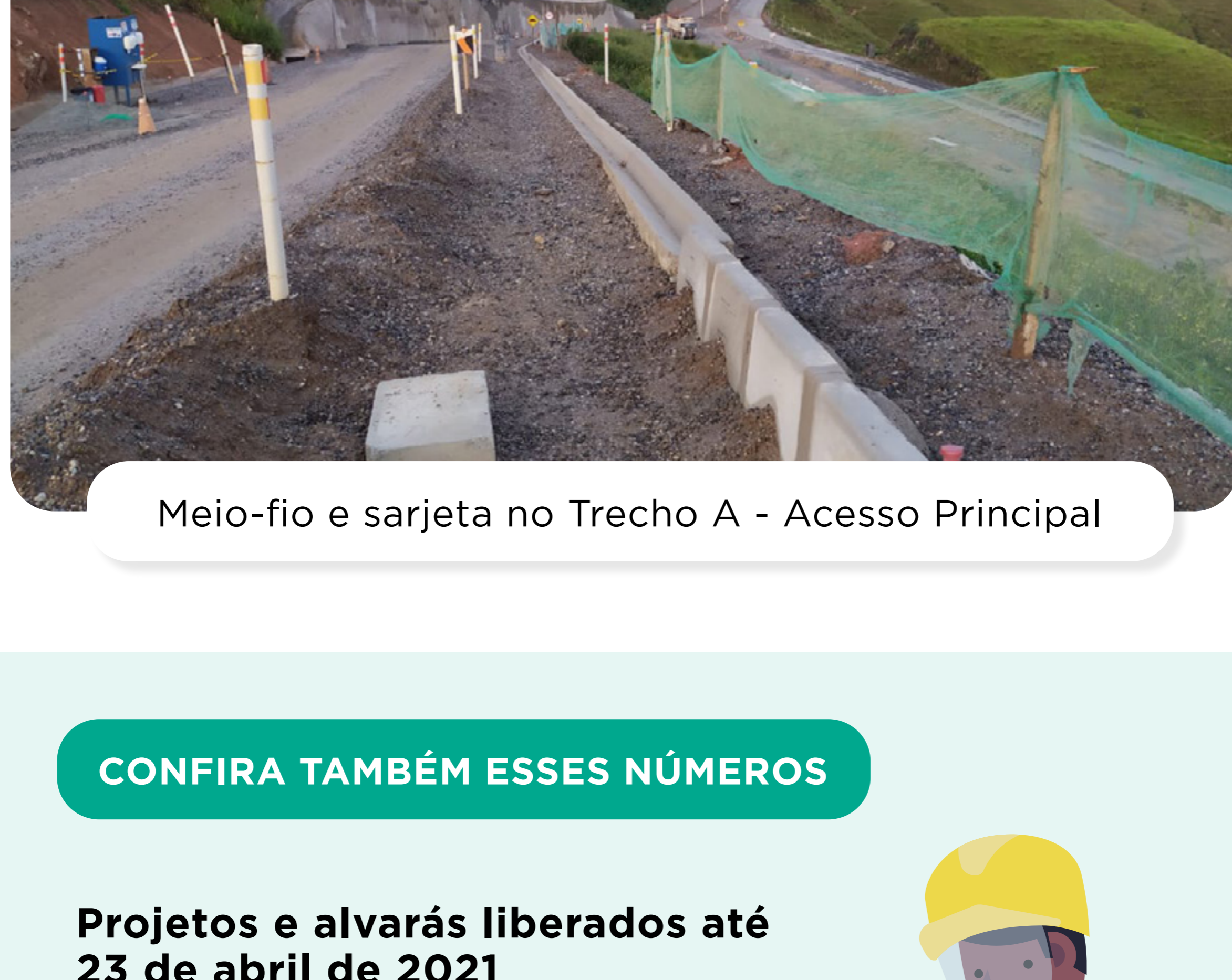
Meio-fio e sarjeta no Trecho A - Acesso Principal

A execução dos dispositivos de drenagem superficial das águas de chuvas e a instalação de meio-fio também continuam.