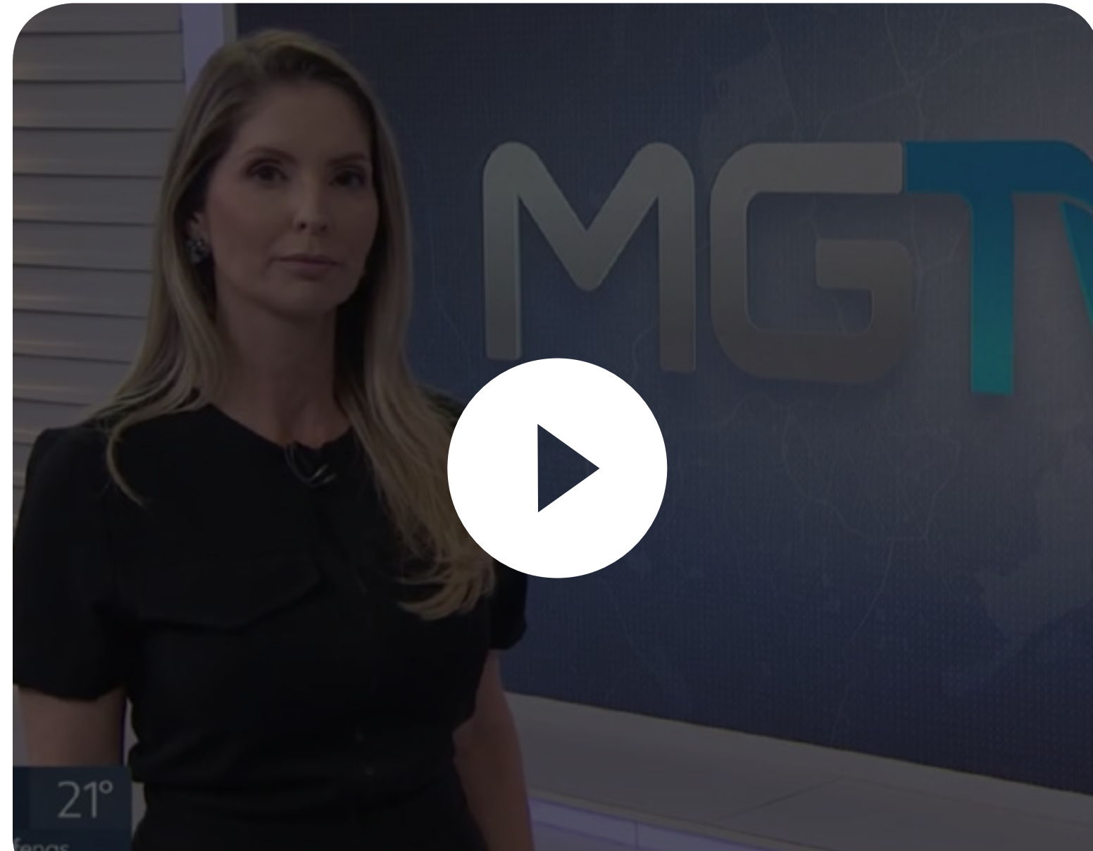
MGTV - Rede GLOBO

A assinatura do contrato com a Andrade Gutierrez saiu em importantes jornais mineiros.