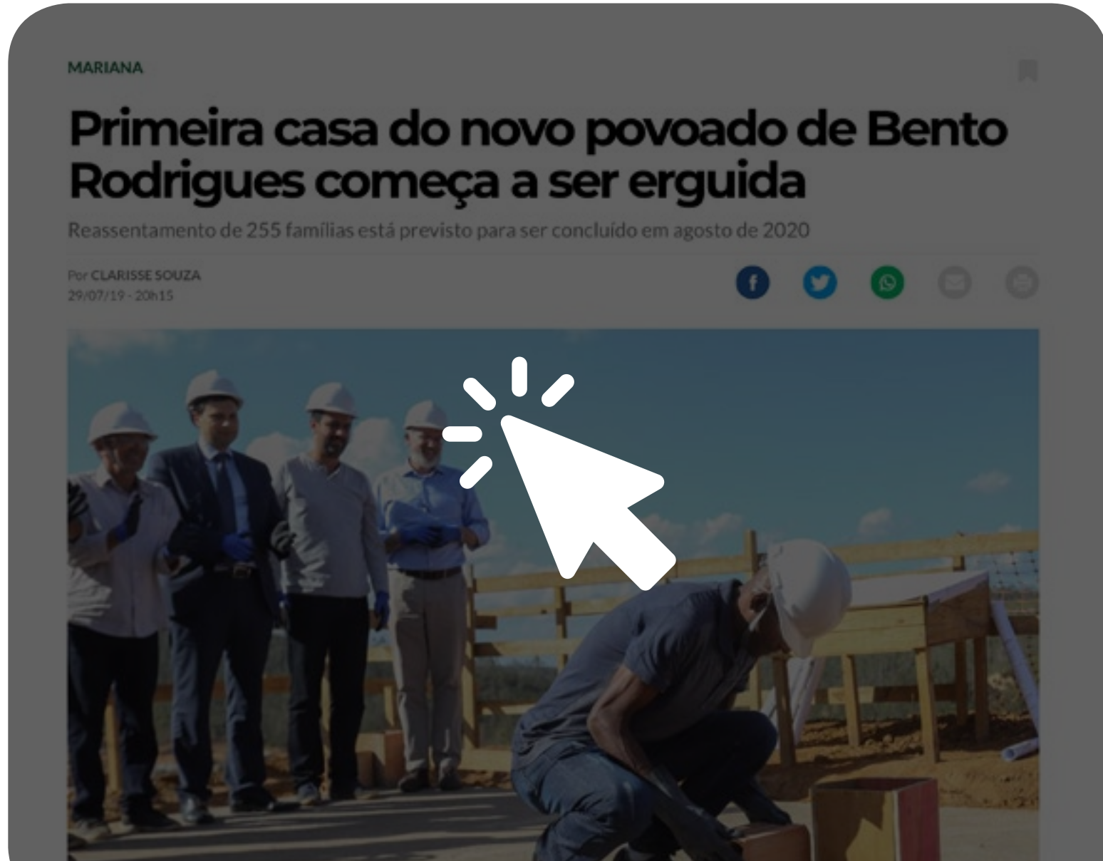
Jornal O Tempo