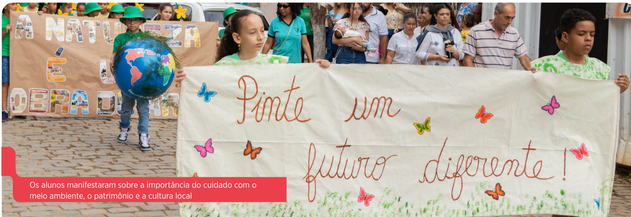
Os alunos manifestaram sobre a importância do cuidado com o meio ambiente, o patrimônio e a cultura local