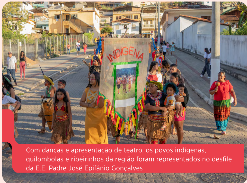
Com danças e apresentação de teatro, os povos indígenas, quilombolas e ribeirinhos da região foram representados no desfile da E.E. Padre José Epifânio Gonçalves