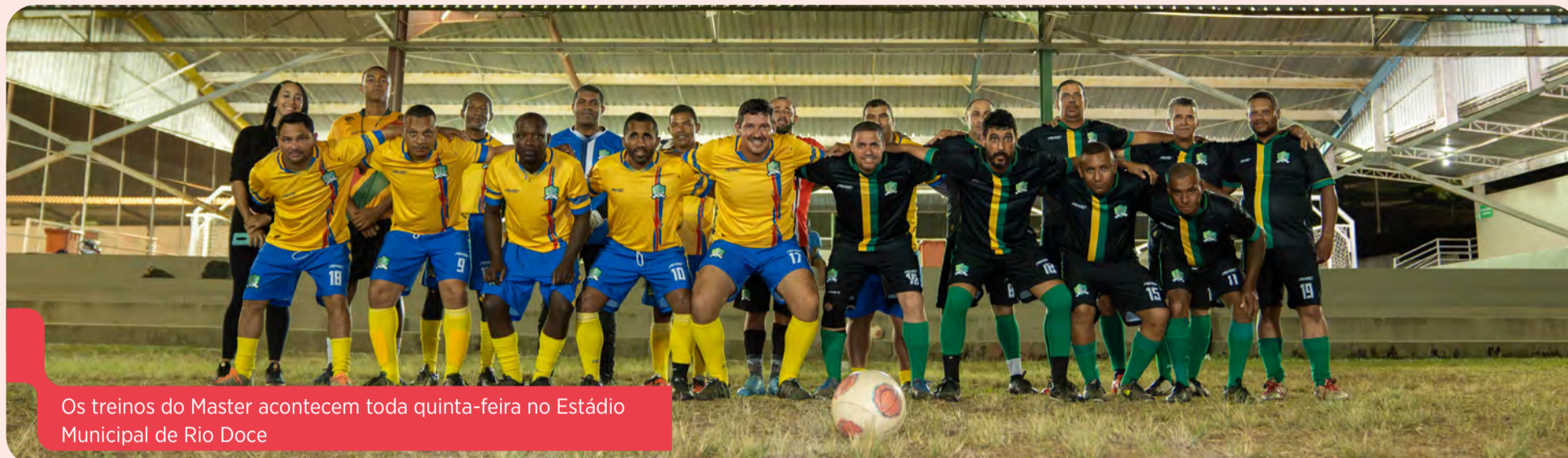
Os treinos do Master acontecem toda quinta-feira no Estádio Municipal de Rio Doce

Para os moradores de Rio Doce, o Estádio Municipal Caetano Cenachi Neto se tornou o ponto de encontro entre amigos. Toda quinta-feira, a turma se junta para jogar bola nos gramados. Os jogos semanais acontecem pelo projeto Master, voltado para pessoas acima de 40 anos, e busca mostrar para os participantes como o esporte pode trazer benefícios para a comunidade e também para o cuidado com o corpo e a mente.