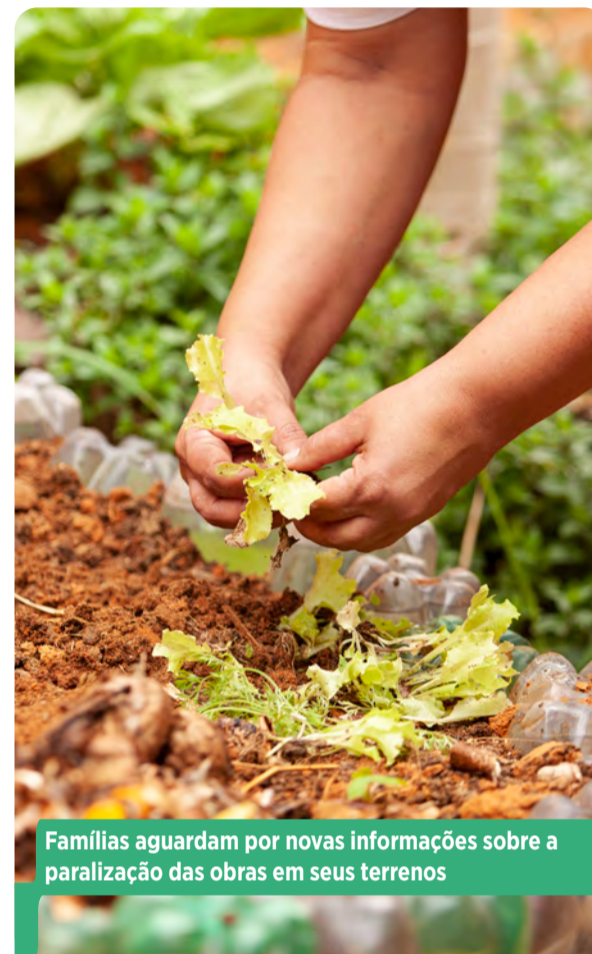
Famílias aguardam por novas informações sobre a paralisação das obras em seus terrenos