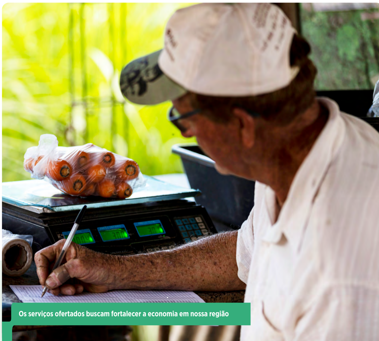
Os serviços ofertados buscam fortalecer a economia em nossa região