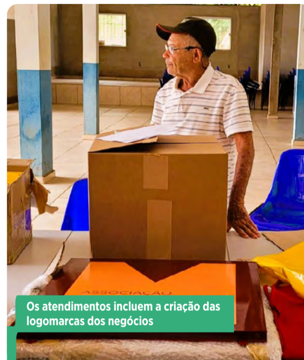
Os atendimentos incluem a criação das logomarcas dos negócios

O trabalho coletivo das associações produtivas também contribui para a circulação de dinheiro em nossa região.