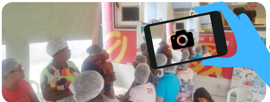
Oficina de educação financeira em comunidade de Linhares