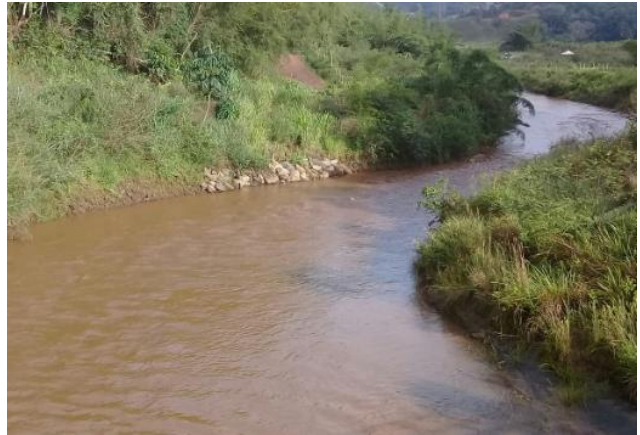
Foto 2: RGN 06: Rio Gualaxo do Norte em Ponte Paracatu em Mariana/MG