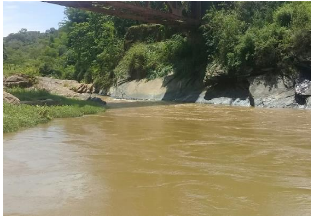
Foto 4 – RCA 01: Rio do Carmo em Acaiaca/MG, em área não afetada com rejeitos