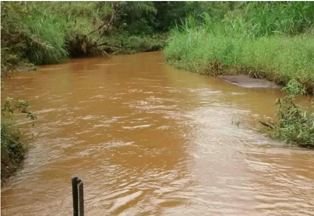
Foto 1 – RGN 01: Rio Gualaxo do Norte a montante da confluência com o córrego Santarém em Mariana/MG, em área não afetada com rejeitos