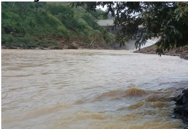
Foto 7 – RDO 02: Rio Doce em Santa Cruz do Escalvado/ MG, após vertedouro da Barragem Candonga