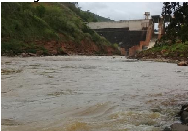
Foto 7 – RDO 02: Rio Doce em Santa Cruz do Escalvado/ MG, após vertedouro da Barragem Candonga