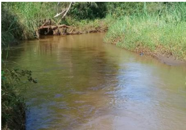
Foto 1 – RGN 01: Rio Gualaxo do Norte a montante da confluência com o córrego Santarém em Mariana/MG, em área não afetada com rejeitos