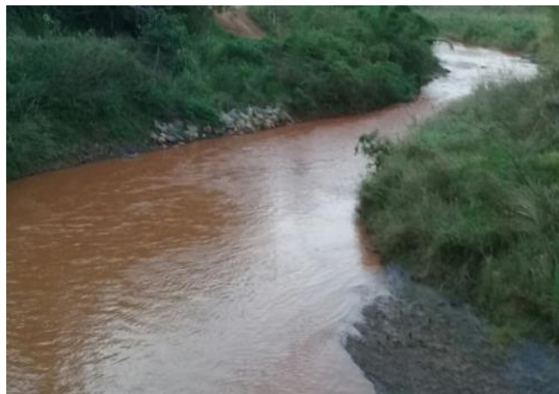
Foto 2: RGN 06: Rio Gualaxo do Norte em Ponte Paracatu em Mariana/MG