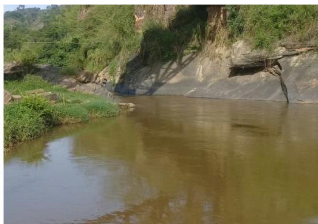
Foto 4 – RCA 01: Rio do Carmo em Acaiaca/MG, em área não afetada com rejeitos