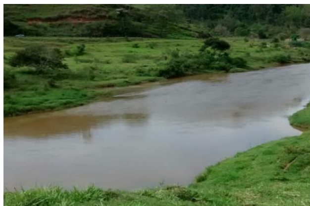
Foto 4 – RCA 01: Rio do Carmo em Acaiaca/MG, em área não afetada com rejeitos