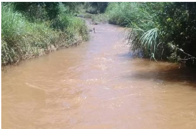
Foto 1 – RGN 01: Rio Gualaxo do Norte a montante da confluência com o córrego Santarém em Mariana/MG, em área não afetada com rejeitos