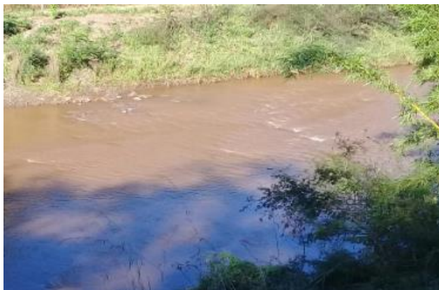
Foto 2: RGN 06: Rio Gualaxo do Norte em Ponte Paracatu em Mariana/MG