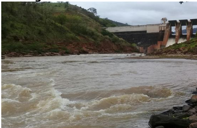
Foto 7 – RDO 02: Rio Doce em Santa Cruz do Escalvado/ MG, após vertedouro da Barragem Candonga