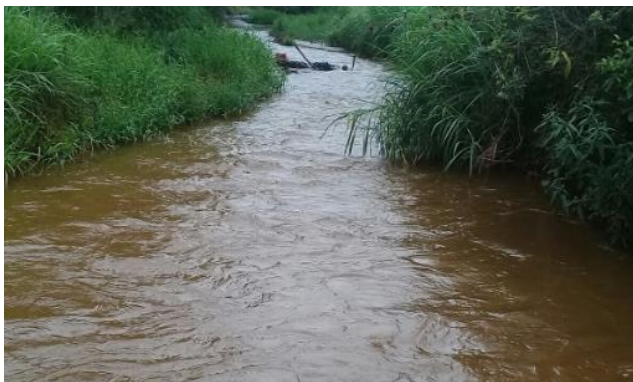
Foto 1 – RGN 01: Rio Gualaxo do Norte a montante da confluência com o córrego Santarém em Mariana/MG, em área não afetada com rejeitos