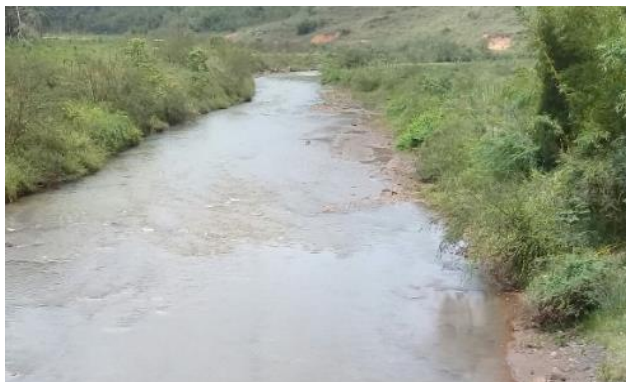
Foto 2: RGN 06: Rio Gualaxo do Norte em Ponte Paracatu em Mariana/MG