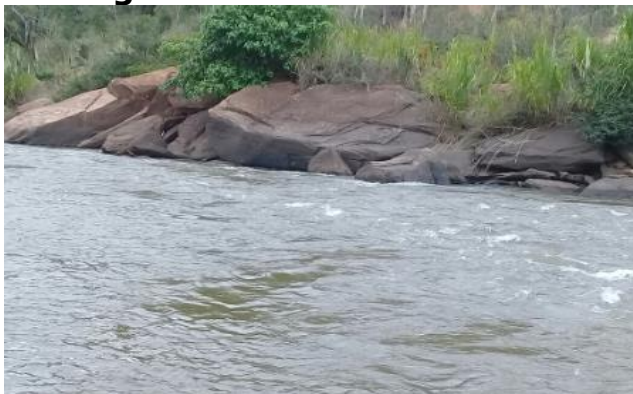
Foto 7 – RDO 02: Rio Doce em Santa Cruz do Escalvado/ MG, após vertedouro da Barragem Candonga