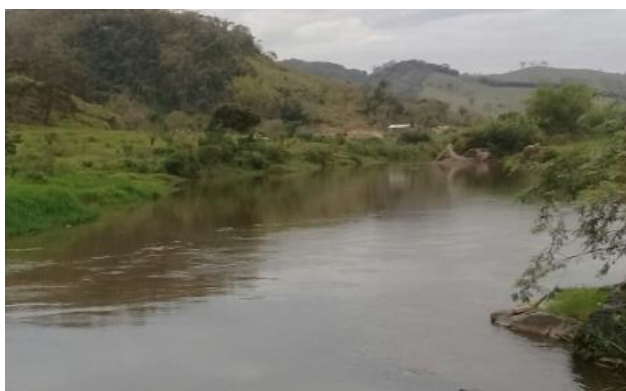
Foto 4 – RCA 01: Rio do Carmo em Acaiaca/MG, em área não afetada com rejeitos