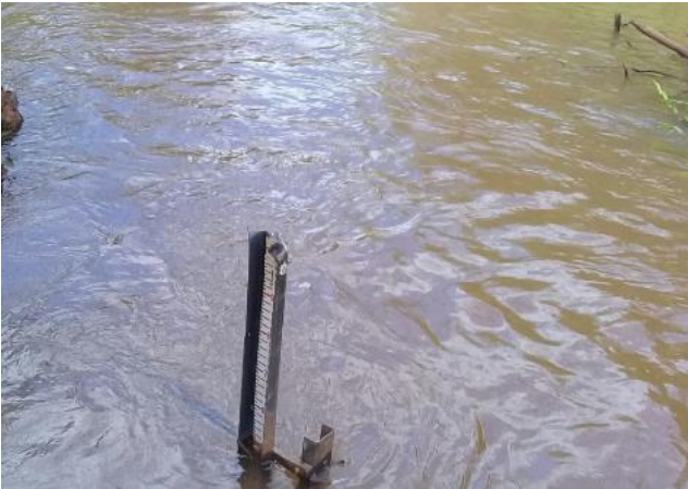
Foto 1 – RGN 01: Rio Gualaxo do Norte a montante da confluência com o córrego Santarém em Mariana/MG, em área não afetada com rejeitos.