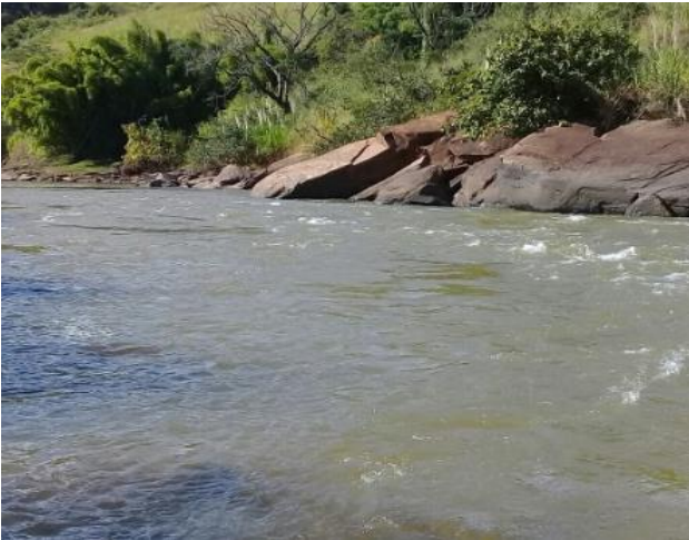
Foto 7 – RDO 02: Rio Doce em Santa Cruz do Escalvado/ MG, após vertedouro da Barragem Candonga