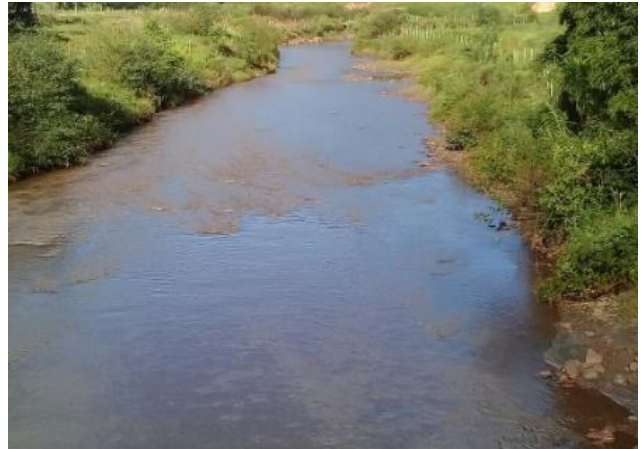
Foto 2: RGN 06: Rio Gualaxo do Norte em Ponte Paracatu em Mariana/MG.