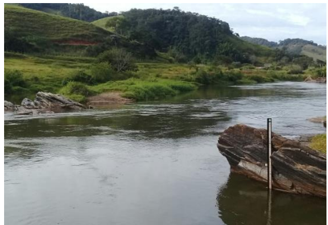
Foto 4 – RCA 01: Rio do Carmo em Acaiaca/MG, em área não afetada com rejeitos.