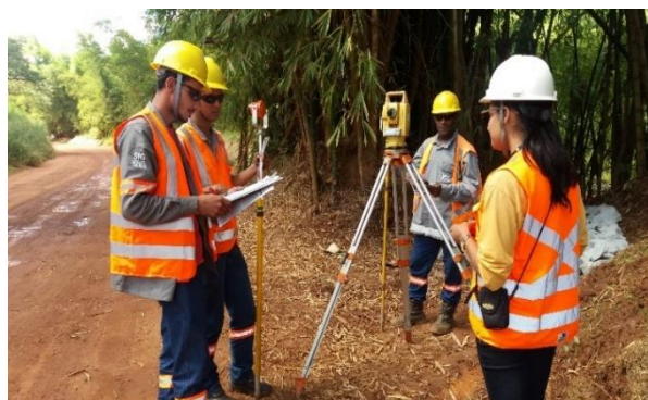
Exemplo de capacitação ocorrida em abril