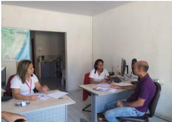
Treinamento sobre o PIM Central de Informação e Atendimento de Pedra Corrida (MG)