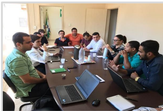
Reunião com Poder Público Periquito/MG (19/04)