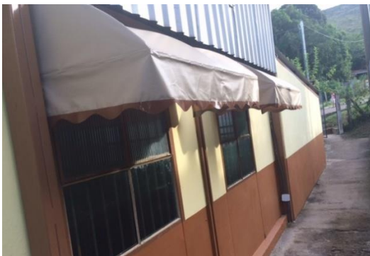
Instalação de toldos nas janelas laterais