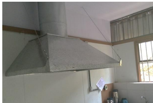
Instalação de coifa para dissipação do calor