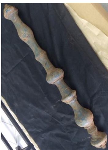
Bazuquilha possivelmente pertencente a Igreja de São Bento – Bento Rodrigues