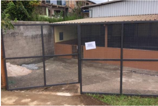
Recuperação do portão com pintura e cadeado