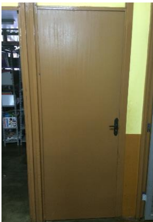
Troca de todas as portas danificadas