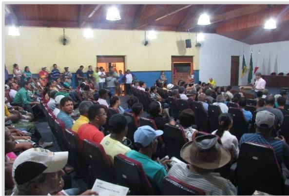
Reunião geral Mariana/MG (06/04)