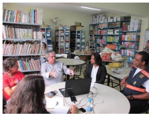
Reunião com Defesa Civil de Mariana