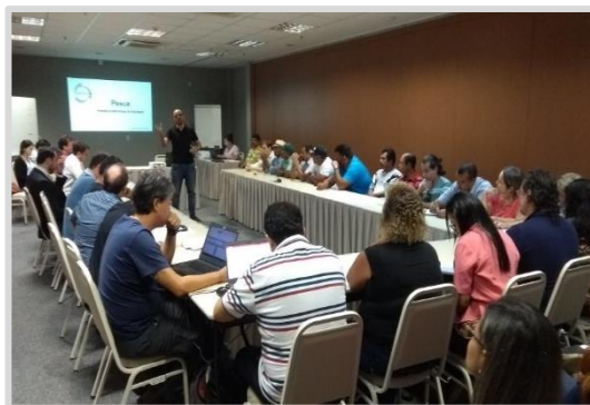
Reunião temática ou com grupos específicos Linhares/ES (12/04)