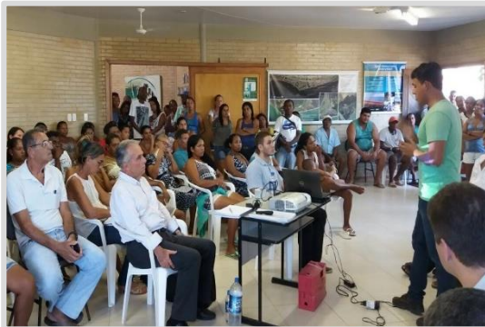
Reunião com lideranças Povoação – Linhares/ES (10/04)