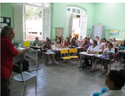
Reunião com Secretaria de Educação de Barra Longa