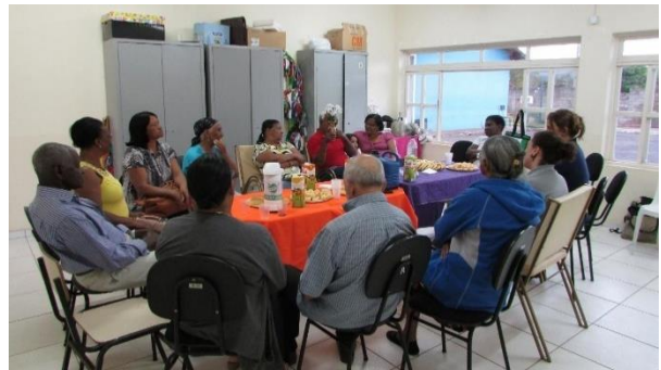
Roda de conversa com grupos de idosos de Bento Rodrigues e Paracatu de Baixo