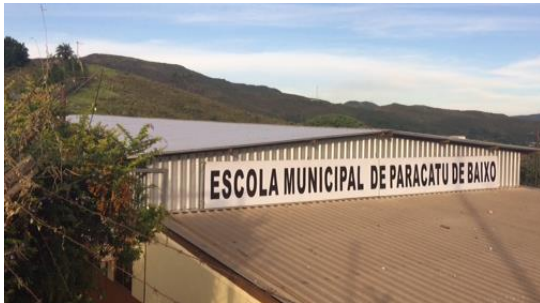
Troca do telhado por telhas com isolamento térmico e instalação de placa com nome da escola