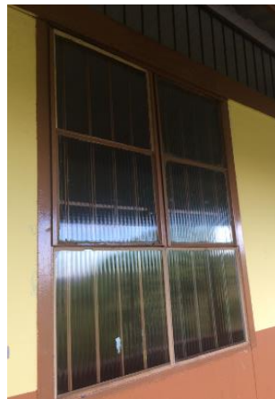
Reparo em todas as janelas danificadas