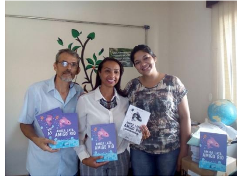
Entrega do material do Projeto Douradinho na Secretaria de Educação de Mariana