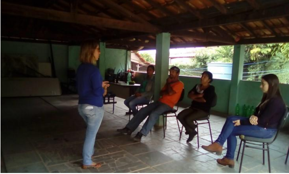
Roda de Conversa – Projeto VertiCRAS