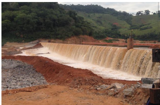
Barramento B concluído