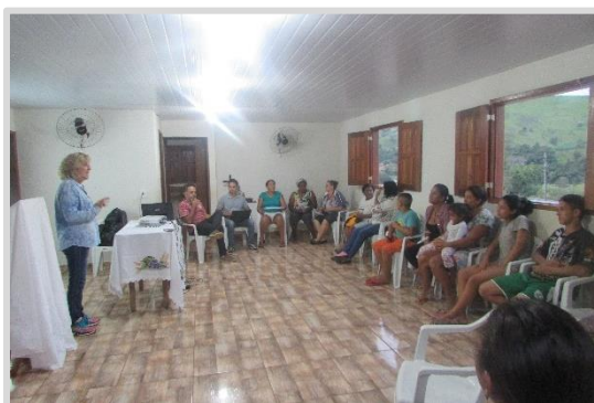
Reunião temática ou com grupos específicos – Resgate do Patrimônio Cultural e Imaterial Gesteira – Barra Longa/MG (19/04)