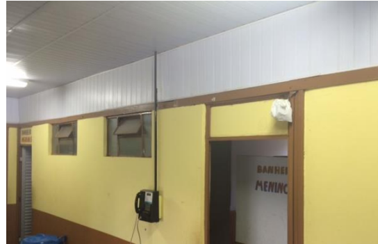
Recuperação do forro em toda a escola