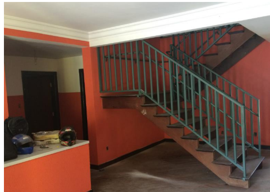
Hall de entrada