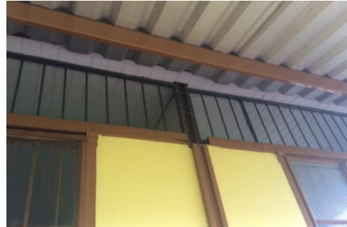
Instalação de grades em todo o perímetro da escola