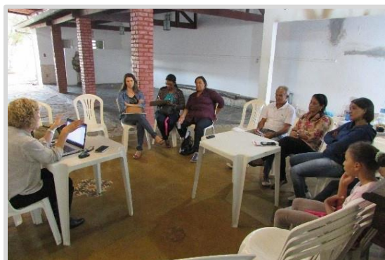
Reunião temática ou com grupos específicos – Preservação da Memória Histórica, Cultural e Artística – Mariana/MG (24/04)