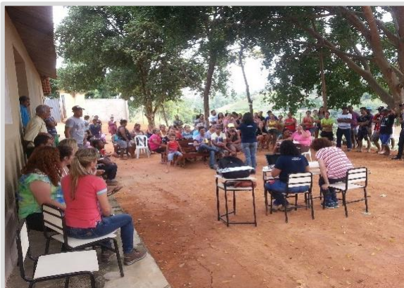
Reunião temática ou com grupos específicos São Lourenço – Bugre/MG(25/04)