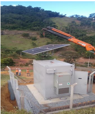
Containers para a instalação das sirenes