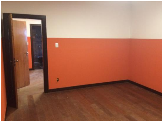
Sala de aula