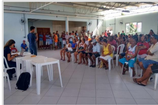
Reunião temática ou com grupos específicos Barra do Riacho – Aracruz/ES (05/04)