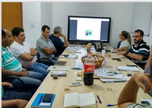
Reunião com poder público Barra Longa/MG (19/04)